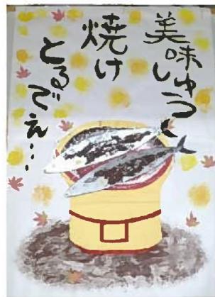
11月の壁画「サンマ 食べたいね」