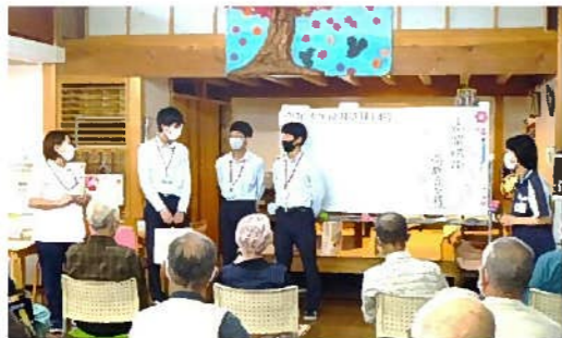
高梁城南高校の生徒さん来所